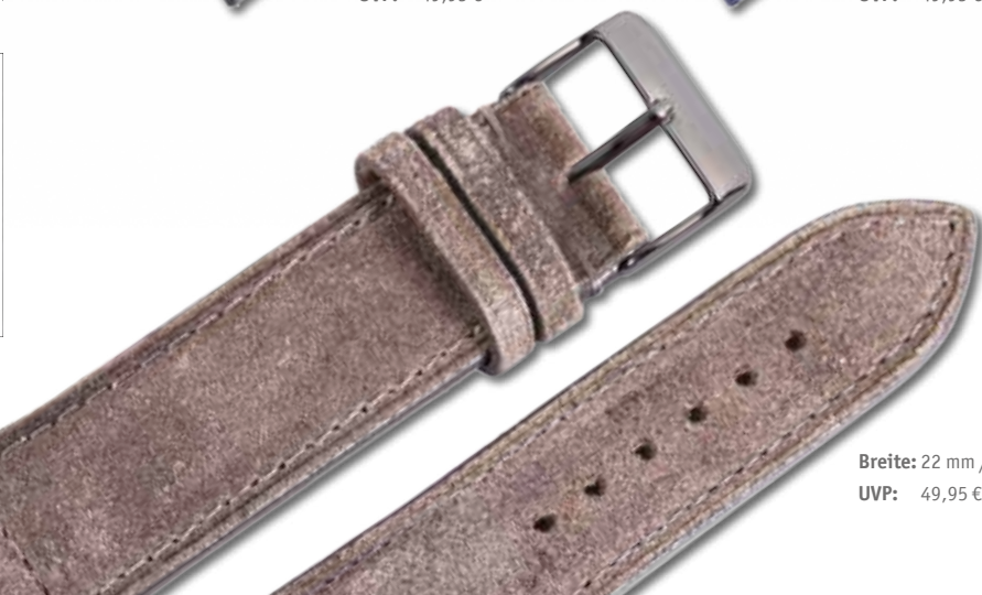
Breite: 22 mm / 709073 UVP: 49,95 €