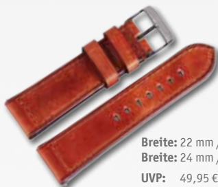
Breite: 22 mm / 709103 Breite: 24 mm / 709202 UVP: 49,95 €