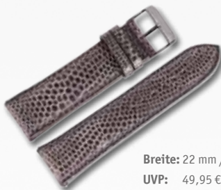
Breite: 22 mm / 709127 UVP: 49,95 €