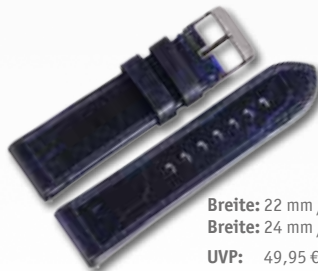
Breite: 22 mm / 709080 Breite: 24 mm / 709196 UVP: 49,95 €