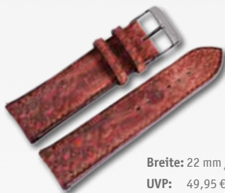
Breite: 22 mm / 709165 UVP: 49,95 €