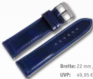
Breite: 22 mm / 709097 UVP: 49,95 €