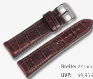
Breite: 22 mm / 709172 UVP: 49,95 €