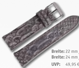
Breite: 22 mm / 709110 Breite: 24 mm / 709182 UVP: 49,95 €